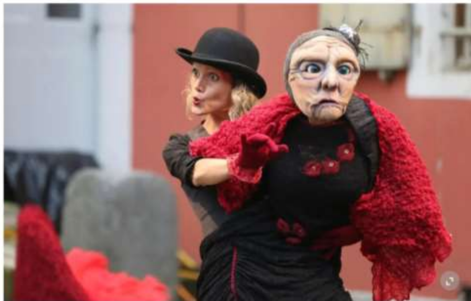
«Victoria» par la Compagnie Les Malles, à découvrir le 2 août.