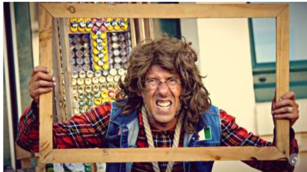
La Compagnie Chicken Street ouvre le bal le 5 juillet. Au menu: western spaghetti.

Les affiches de festivals voués au théâtre de rue s'avérant souvent fort masculines, la dame a également visé la parité. Ajoutez à ça quelques contraintes techniques. «Il n'y a pas d'électricité sur place. Le Canton n'a pas voulu nous brancher. Et le sol n'est pas bétonné, ce qui interdit un certain nombre de numéros. Il faut que tout reste très léger. On arrive. On s'installe. On joue. On s'en va. Ce n'est pas un lieu où l'on plante des clous.»